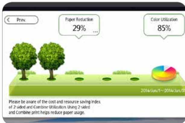
Eco-Friendly Indicator Screen as shown on Smart Operation Panel.

Nous nous efforçons à être protecteurs de l'environnement, alors nous vous offrons de nombreux moyens pour être responsables de votre consommation d'énergie et de votre utilisation de papier. L'appareil Ricoh MP C401/MP C401SR offre des modes d'économie d'énergie avancés pour réduire la consommation d'énergie. Programmez-le pour s'éteindre ou s'allumer automatiquement afin de conserver de l'énergie pendant les temps d'arrêt prévus. Profitez de l'option recto-verso standard pour réduire la quantité de papier et les coûts connexes. Établissez des quotas d'impression pour les utilisateurs individuels ou les groupes afin de réduire l'impression inutile. Et, utilisez l'indicateur écologique intégré pour voir combien de papier votre équipe économise. Ces modèles répondent aux nouvelles normes rigides pour la certification ENERGY STAR™ 2.0 et ont été qualifiés pour la cote Or d'EPEAT®.