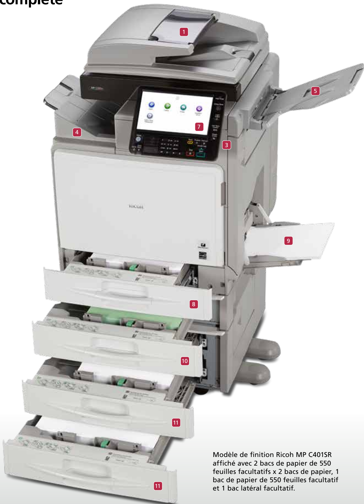
Modèle de finition Ricoh MP C401SR affiché avec 2 bacs de papier de 550 feuilles facultatifs x 2 bacs de papier, 1 bac de papier de 550 feuilles facultatif et 1 bac latéral facultatif.