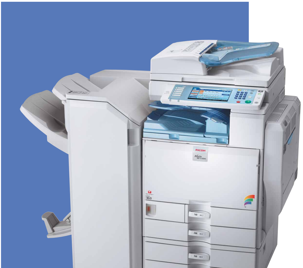
Aficio™ MP C3500/MP C4500

Solutions multifonctions N&B et couleur pour les plus exigeants