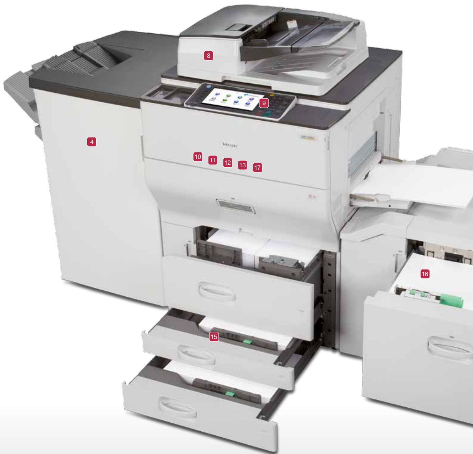
Ricoh MP C6502/MP C8002