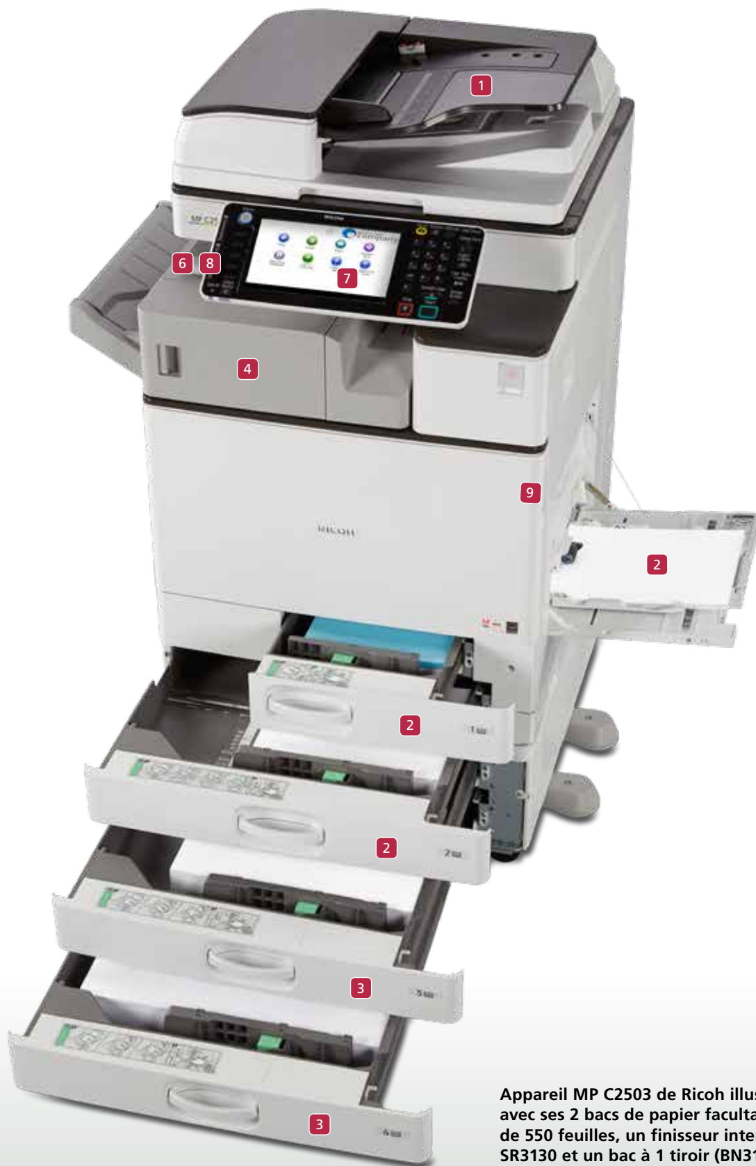
Appareil MP C2503 de Ricoh illustré avec ses 2 bacs de papier facultatifs de 550 feuilles, un finisseur interne SR3130 et un bac à 1 tiroir (BN3110)